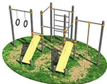
УЛИЧНЫЙ ТРЕНАЖЕР РОССИ «СПОРТИВНЫЙ