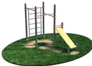
УЛИЧНЫЙ ТРЕНАЖЕР РОССИ «СПОРТИВНЫЙ