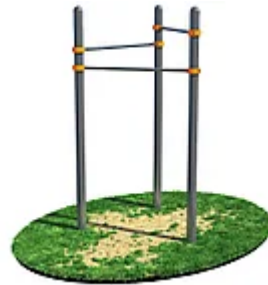
УЛИЧНЫЙ ТРЕНАЖЕР РОССИ «ТУРНИК ДЛЯ