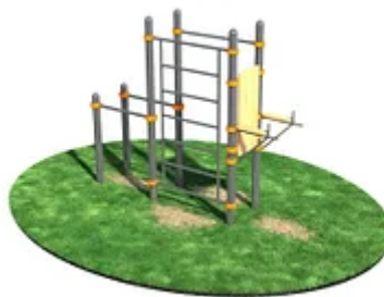
УЛИЧНЫЙ ТРЕНАЖЕР РОССИ «СПОРТИВНЫЙ