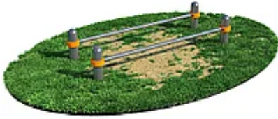
УЛИЧНЫЙ ТРЕНАЖЕР РОССИ «БРУСЬЯ