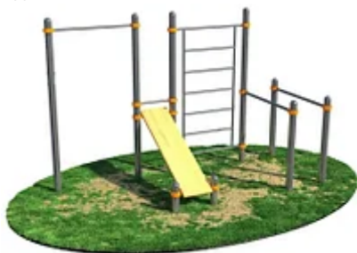
УЛИЧНЫЙ ТРЕНАЖЕР РОССИ «СКАМЬЯ ДЛЯ