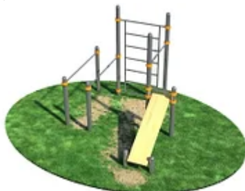
УЛИЧНЫЙ ТРЕНАЖЕР РОССИ «СПОРТИВНЫЙ