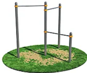
УЛИЧНЫЙ ТРЕНАЖЕР РОССИ "ТРОЙНОЙ