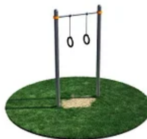
УЛИЧНЫЙ ТРЕНАЖЕР РОССИ «ТУРНИК С

Архангельск (8182)63-90-72 Астана (7172)727-132 Астрахань (8512)99-46-04 Барнаул (3852)73-04-60 Белгород (4722)40-23-64 Брянск (4832)59-03-52 Владивосток (423)249-28-31 Волгоград (844)278-03-48 Вологда (8172)26-41-59 Воронеж (473)204-51-73 Екатеринбург (343)384-55-89 Иваново (4932)77-34-06