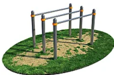
УЛИЧНЫЙ ТРЕНАЖЕР РОССИ «БРУСЬЯ