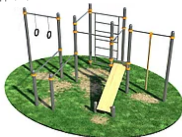
УЛИЧНЫЙ ТРЕНАЖЕР РОССИ «СПОРТИВНЫЙ