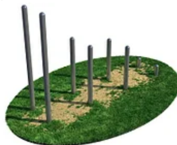
УЛИЧНЫЙ ТРЕНАЖЕР РОССИ «СТОЛБИКИ ДЛЯ