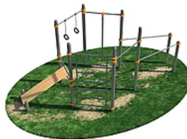
УЛИЧНЫЙ ТРЕНАЖЕР РОССИ «СПОРТИВНЫЙ