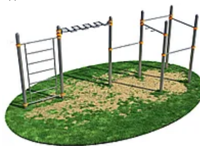
УЛИЧНЫЙ ТРЕНАЖЕР РОССИ «СПОРТИВНЫЙ