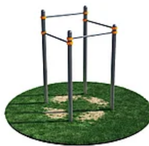
УЛИЧНЫЙ ТРЕНАЖЕР РОССИ «КОМПЛЕКС