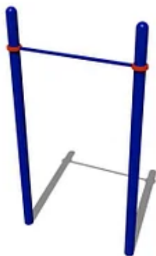
УЛИЧНЫЙ ТРЕНАЖЕР РОССИ «ТУРНИК»