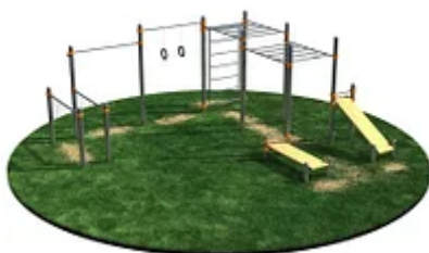
УЛИЧНЫЙ ТРЕНАЖЕР РОССИ «СПОРТИВНЫЙ