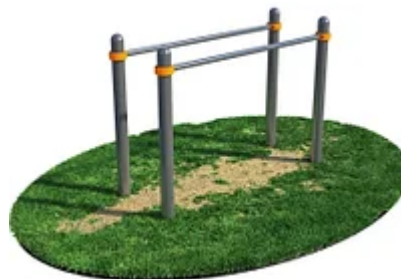
УЛИЧНЫЙ ТРЕНАЖЕР РОССИ «БРУСЬЯ