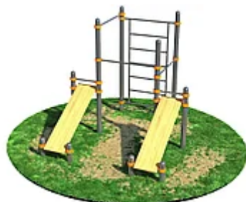
УЛИЧНЫЙ ТРЕНАЖЕР РОССИ «СПОРТИВНЫЙ