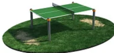
УЛИЧНЫЙ ТРЕНАЖЕР РОССИ