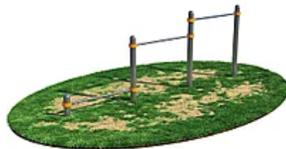
УЛИЧНЫЙ ТРЕНАЖЕР РОССИ "ПЕРЕКЛАДИНЫ