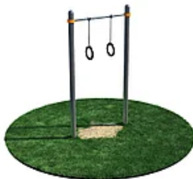
УЛИЧНЫЙ ТРЕНАЖЕР РОССИ "ТУРНИК С