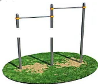
УЛИЧНЫЙ ТРЕНАЖЕР РОССИ "ТУРНИК