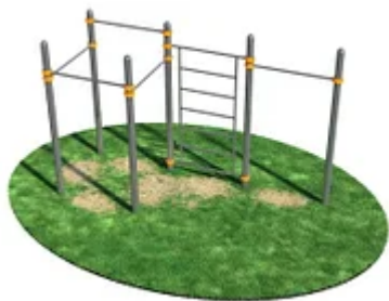
УЛИЧНЫЙ ТРЕНАЖЕР РОССИ «СПОРТИВНЫЙ