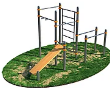
УЛИЧНЫЙ ТРЕНАЖЕР РОССИ «СПОРТИВНЫЙ