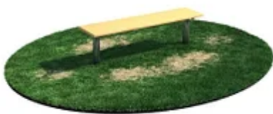
УЛИЧНЫЙ ТРЕНАЖЕР РОССИ «СКАМЬЯ ДЛЯ