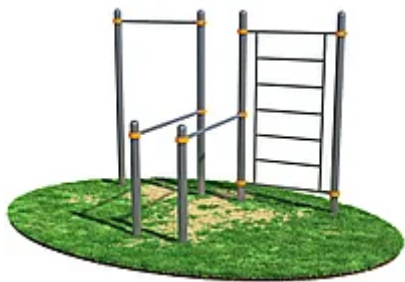
УЛИЧНЫЙ ТРЕНАЖЕР РОССИ «ТУРНИК, БРУСЬЯ