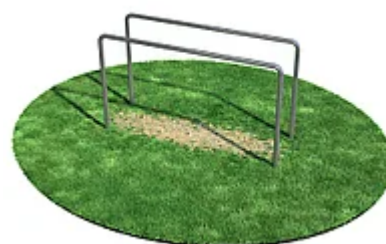
УЛИЧНЫЙ ТРЕНАЖЕР РОССИ «БРУСЬЯ