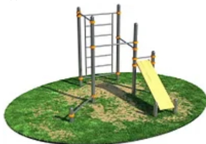
УЛИЧНЫЙ ТРЕНАЖЕР РОССИ «СКАМЬЯ ДЛЯ