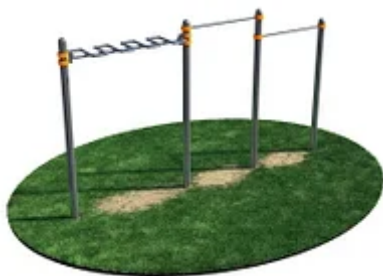
УЛИЧНЫЙ ТРЕНАЖЕР РОССИ «ДВОЙНОЙ