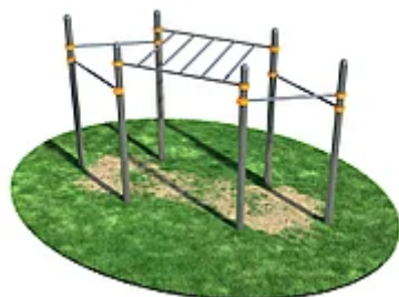
УЛИЧНЫЙ ТРЕНАЖЕР РОССИ «РУКОХОД С