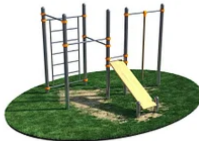
УЛИЧНЫЙ ТРЕНАЖЕР РОССИ «СПОРТИВНЫЙ