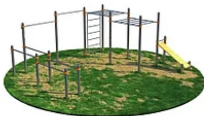
УЛИЧНЫЙ ТРЕНАЖЕР РОССИ «СПОРТИВНЫЙ