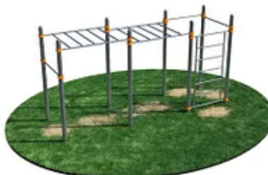
УЛИЧНЫЙ ТРЕНАЖЕР РОССИ «СПОРТИВНЫЙ