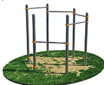
УЛИЧНЫЙ ТРЕНАЖЕР РОССИ «КОМПЛЕКС