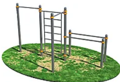
УЛИЧНЫЙ ТРЕНАЖЕР РОССИ «ДВА ТУРНИКА,