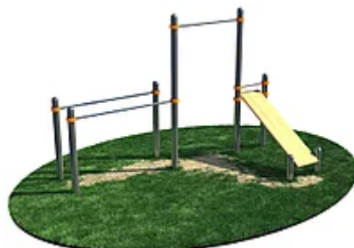
УЛИЧНЫЙ ТРЕНАЖЕР РОССИ «ТУРНИК, БРУСЬЯ