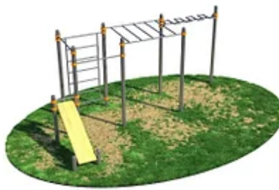
УЛИЧНЫЙ ТРЕНАЖЕР РОССИ «СПОРТИВНЫЙ