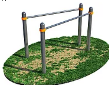
УЛИЧНЫЙ ТРЕНАЖЕР РОССИ «БРУСЬЯ