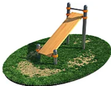
УЛИЧНЫЙ ТРЕНАЖЕР РОССИ «СКАМЬЯ ДЛЯ