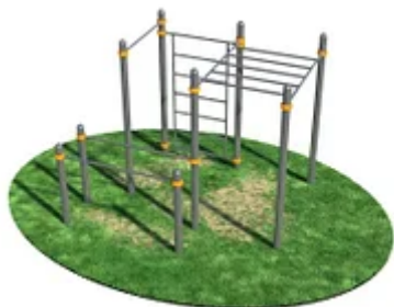
УЛИЧНЫЙ ТРЕНАЖЕР РОССИ «СПОРТИВНЫЙ