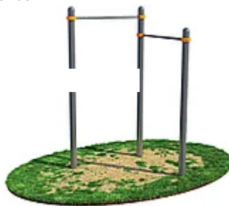
УЛИЧНЫЙ ТРЕНАЖЕР РОССИ "ТУРНИК