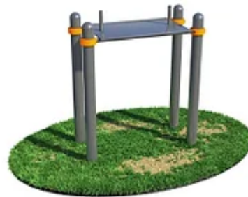
УЛИЧНЫЙ ТРЕНАЖЕР РОССИ