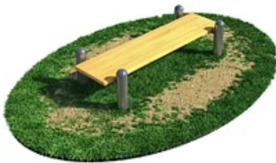
УЛИЧНЫЙ ТРЕНАЖЕР РОССИ «СКАМЬЯ ДЛЯ