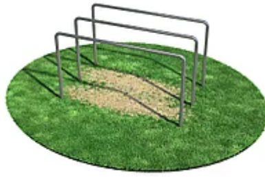
УЛИЧНЫЙ ТРЕНАЖЕР РОССИ «БРУСЬЯ