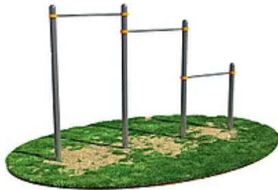
УЛИЧНЫЙ ТРЕНАЖЕР РОССИ "ТУРНИК