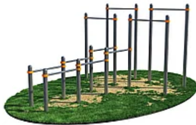
УЛИЧНЫЙ ТРЕНАЖЕР РОССИ «КОМПЛЕКС