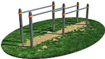
УЛИЧНЫЙ ТРЕНАЖЕР РОССИ «БРУСЬЯ