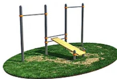
УЛИЧНЫЙ ТРЕНАЖЕР РОССИ «СКАМЬЯ ДЛЯ