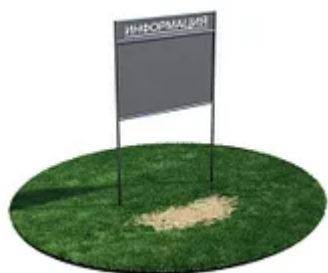
УЛИЧНЫЙ ТРЕНАЖЕР РОССИ