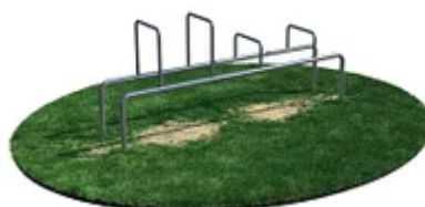
УЛИЧНЫЙ ТРЕНАЖЕР РОССИ «СКАМЬЯ-