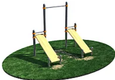
УЛИЧНЫЙ ТРЕНАЖЕР РОССИ «ТУРНИК И ДВЕ