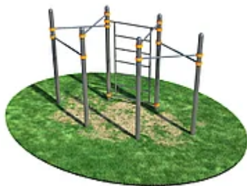
УЛИЧНЫЙ ТРЕНАЖЕР РОССИ «ШВЕДСКАЯ