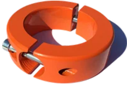
ХОМУТ ДЛЯ ВОРКАУТ (WORKOUT)