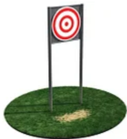
УЛИЧНЫЙ ТРЕНАЖЕР РОССИ «ЦЕЛЬ ДЛЯ