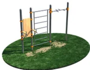
УЛИЧНЫЙ ТРЕНАЖЕР РОССИ «СПОРТИВНЫЙ