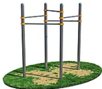
УЛИЧНЫЙ ТРЕНАЖЕР РОССИ «КОМПЛЕКС