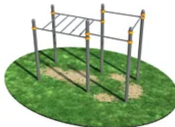
УЛИЧНЫЙ ТРЕНАЖЕР РОССИ «РУКОХОД С