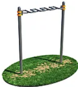
УЛИЧНЫЙ ТРЕНАЖЕР РОССИ «РУКОХОД