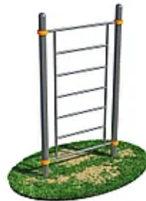
УЛИЧНЫЙ ТРЕНАЖЕР РОССИ «ШВЕДСКАЯ