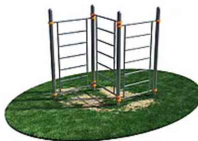
УЛИЧНЫЙ ТРЕНАЖЕР РОССИ «ШВЕДСКАЯ