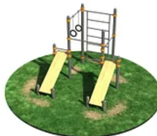
УЛИЧНЫЙ ТРЕНАЖЕР РОССИ «СПОРТИВНЫЙ