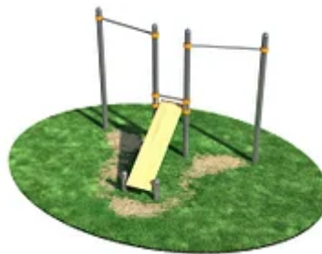
УЛИЧНЫЙ ТРЕНАЖЕР РОССИ «ЛАВКА ДЛЯ