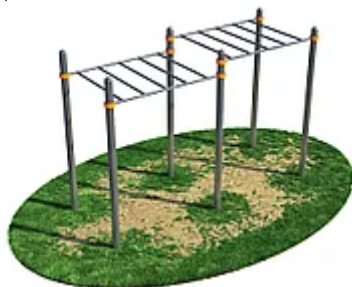
УЛИЧНЫЙ ТРЕНАЖЕР РОССИ «РУКОХОД» ДЛЯ